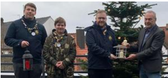
Stamm Löwe von Meissen, Neustadt beim Oberbürgermeister (oben)

Auch der BR berichtete mit einem Fernsenteam über die Veranstaltung aus der Nürnberger Lorenzkirche.